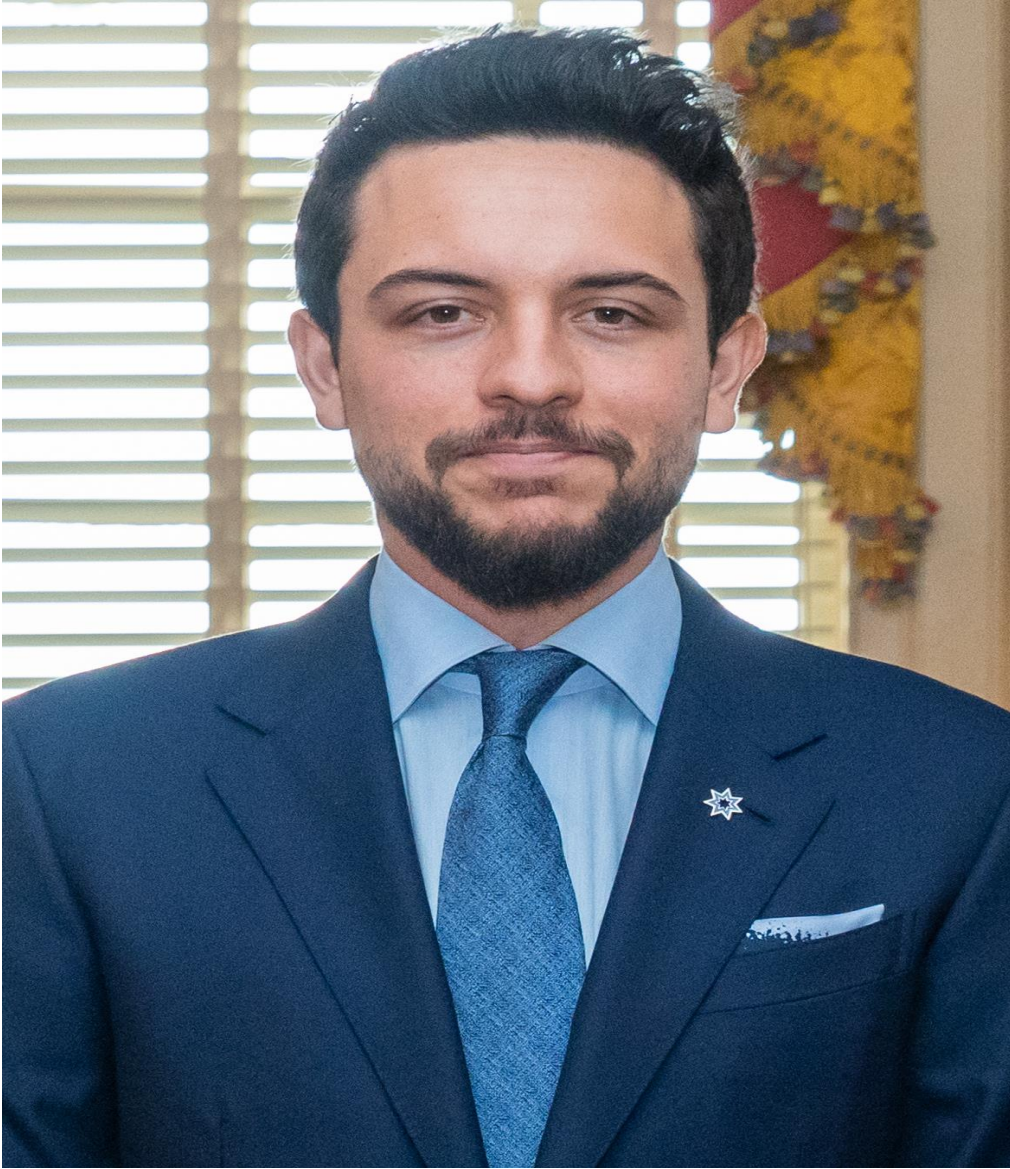
صاحب السمو الملكي الأمير حسين بن عبدالله حفظه الله