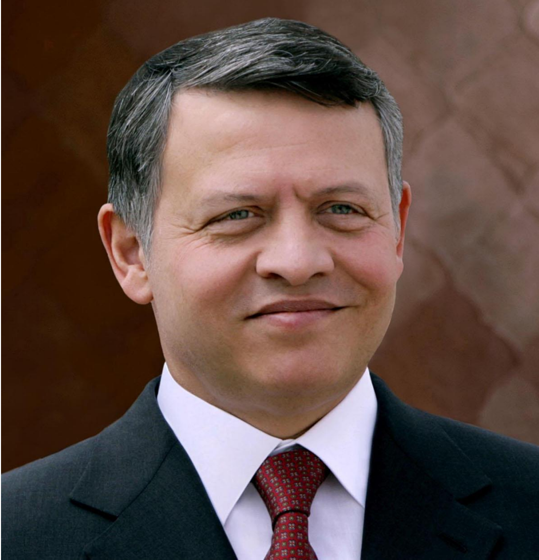
حضرة صاحب الجلالة الهاشمية الملك عبدالله الثاني ابن الحسين المعظم حفظه الله