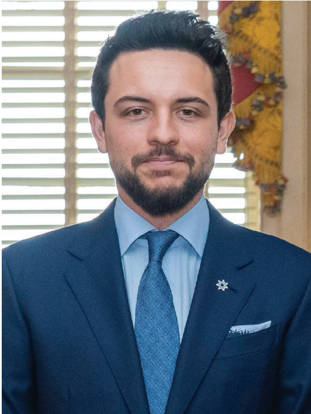
صاحب السمو الملكي الأمير حسين بن عبد الله حفظه الله